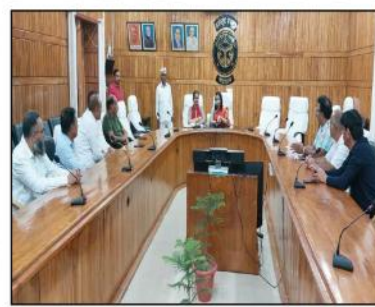
से भी लोगों को जागरूक किया जाय। सेल्फी विद तिरंगा जैसे युवाओं के लिए रचिकर कार्यक्रमों के माध्यम से आमजन विशेषकर युवक-युवतियों को कार्यक्रम में सहभागिता के लिए प्रोत्साहित किया जाए। ताकि सभी लोग आपसी भेद-भाव मिटाकर समरस भाव से इस आयोजन से जुड़ें। प्रतियोगिताओं

अमृत महोत्सव अंतर्गत सम्पन्न होने वाले कार्यक्रमों में शत-प्रतिशत छात्र-छात्राओं की सहभागिता सुनिश्चित की जाए। बैठक में मौजूद विद्यालय संचालकों द्वारा बताया गया कि नान एडेड प्राइवेट स्कूल एग्रेसिएशन (एनएपीएस) बहराइच के तत्वाधान में 14 अगस्त को इन्दिरा स्टेडियम से कलेक्ट्रेट तक तिरंगा यात्रा निकाली जायेगी। डीएम ने संचालकों एवं प्रधानाचार्यों को निर्देश दिया कि 09 से 15 अगस्त तक स्वतंत्रता सप्ताह के दौरान हर दिन के लिए अलग-अलग कार्यक्रम तैयार किए जायें। स्कूलों एवं कालेजों में असेम्बली के समय झण्डा गीतों का गायन किया जाय। तिरंगा के सफर पर आधारित प्रदर्शनियों, वाद-विवाद, नृत्य, रंगोली, पेंटिंग व निबन्ध लेखन प्रतियोगिताओं के साथ-साथ पौधारोपण व नुककड़ नाटक के माध्यम