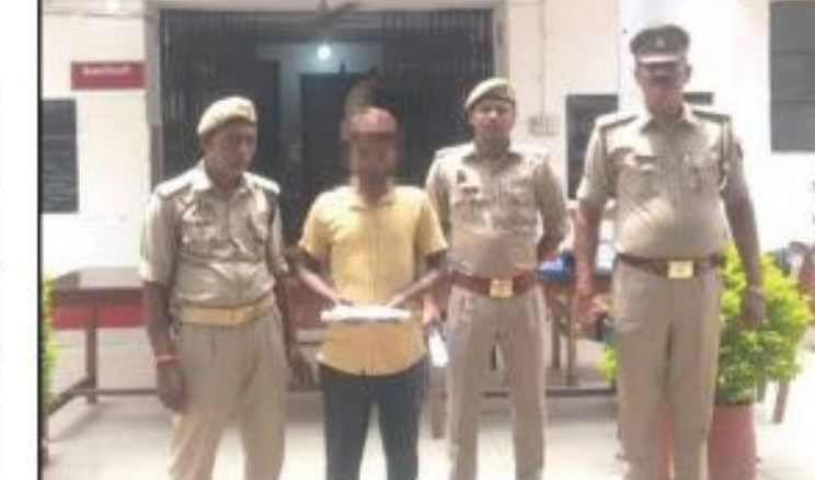
अमन लेखनी समाचार

मुसाफिरखाना, अमेठी। पुलिस अधीक्षक के निर्देश पर अपराध एवं अपराधियों पर अंकुश लगाए जाने हेतु चलाए जा रहे धर पकड़ अभियान के तहत कोतवाली पुलिस वांछित चल रहे दो वारंटी अभियुक्त को गिरफ्तार कर विधिक कार्यवाही करते हुए न्यायालय में पेश करने हेतु भेजा गया।