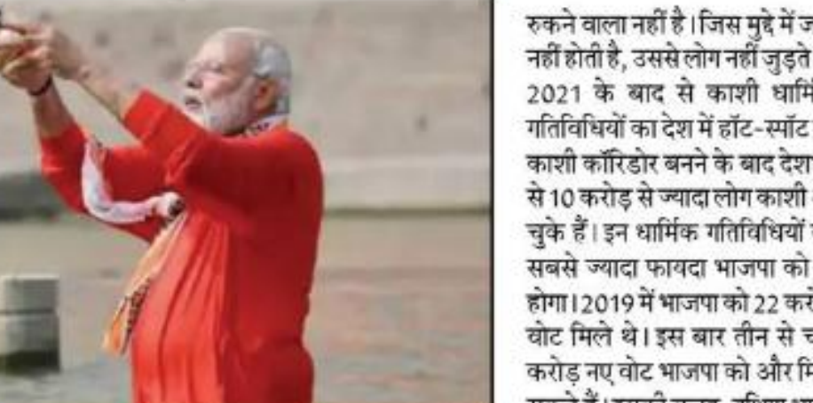
काशी की घटनाओं का सीधा प्रभाव दक्षिण भारत पर पड़ता है

लखनऊ, 2024 आम चुनाव में काशी और ज्ञानवापी भाजपा के लिए अयोध्या और राम मंदिर साबित हो सकते हैं। ऐसा इसलिए, क्योंकि काशी का कनेक्शन और ज्ञानवापी का मुद्दा बढ़ा बनता जा रहा है।