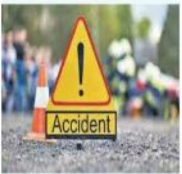
अमन लेखनी समाचार

आगरा- एक्सप्रेसवे पर ट्रक ने कार में मारी टक्कर; तीन घायल