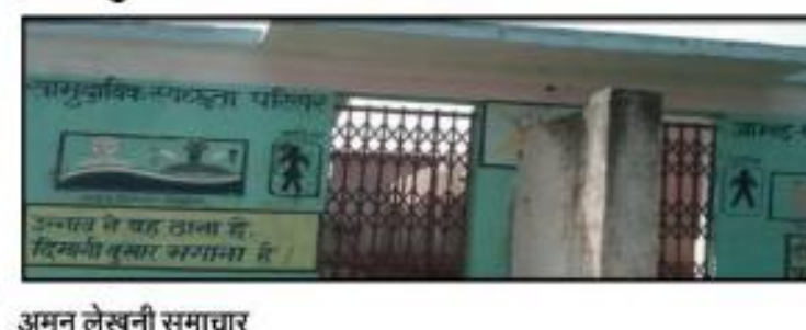
अमन लेखनी समाचार

बांगरमऊ, उन्नाव। विकासखंड क्षेत्र के अंतर्गत ग्राम डोंडिया मजर जामड प्रधान की मनमानी के चलते सामुदायिक शौचालय में लगा रहता है ताला लोप खुले में शौच किया करने को है मजदूर लाखों रूपए से निर्मित सामुदायिक शौचालय में गंदगी व ताला पड़ा रहता है जबकि सरकार द्वारा सामुदायिक शौचालय प्रामाणिकों को सुविधा के लिए बनवाए गए थे।