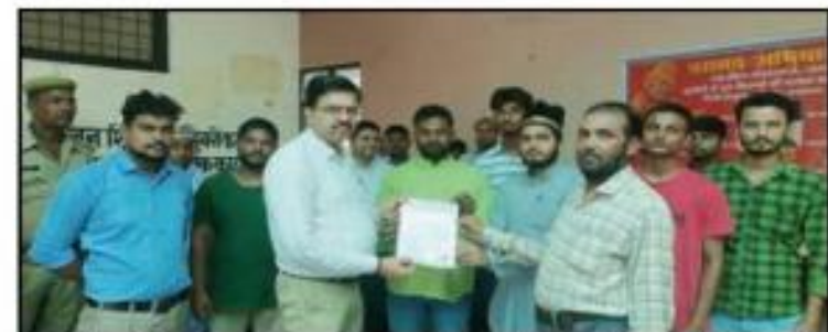
अमन लेखनी समाचार

कैसरगंज, बहराइच। कैसरगंज तहसील में ऑल इण्डिया पसमाब्दा मुस्लिम महाज ने ज्ञापन सौपा। भारतीय संविधान के अनुच्छेद 341 पर लगे धार्मिक प्रतिबंध को समाप्त करके दलित मुसलमानों और दलित ईसाइयों को अनुसूचित जाति की सूची में शामिल करने के संबंध में यह ज्ञापन दिया गया।