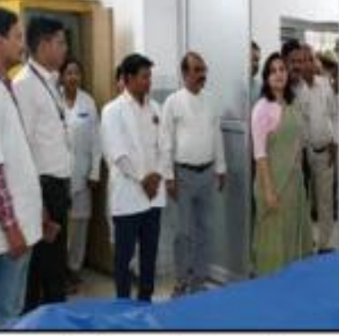
अमन लेखनी समाचार

बहराइच। विगत 20 जुलाई को महर्षि बालार्क चिकित्सालय के ओरक निरीक्षण के दौरान चिकित्सालय में आने वाले मरीजों एवं तीमारदारों तथा सम्बन्धित स्टाफ की मुश्किलों को हेतु दिये गये निर्देशों के सम्बन्ध में की गई कार्यवाही का जायजा लेने के उद्देश्य से जिलाधिकारी मोनिकारानी ने महर्षि बालार्क चिकित्सालय का निरीक्षण किया। निरीक्षण के दौरान डीएम को बताया कि ग्या कि पूर्व में दिये गये निर्देशों के क्रम में पंजीकरण काउण्टर का विस्तार करा दिया गया है। काउण्टर का विस्तार हो जाने से मरीजों के साथ-साथ सम्बन्धित स्टाफ को भी कार्य करने में आसानी होगी। विगत निरीक्षण के दौरान जिलाधिकारी