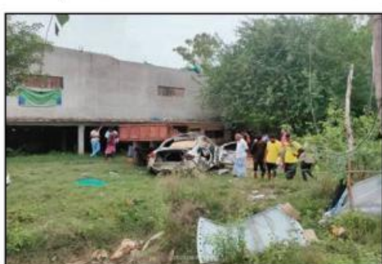
अमन लेखनी समाचार

उन्नाव। थाना क्षेत्र के मोरौवा मोहन लाल गंज मार्ग पर मवेशी को बचाने के चक्कर में अनियंत्रित कार की ट्रैक्टर ट्राली से जोरदार टक्कर हो गई जिसमें सवार दो युवकों की घटना स्थल पर दर्दनाक मौत हो गई तीन साथी गंभीर रूप से घायल हो गए जिन्हें सी एच सी से ट्रामा सेंटर लखनऊ भेजा गया।