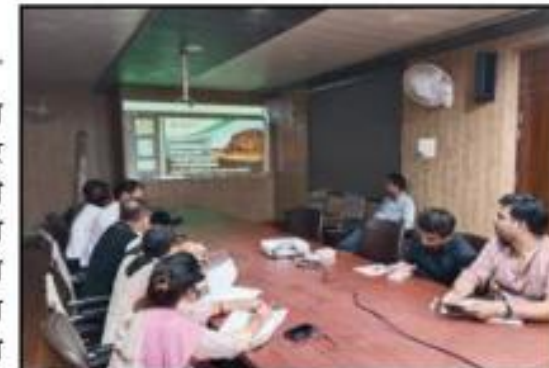
अमन लेखनी समाचार

उन्नाव। मुख्य चिकित्सा अधिकारी कार्यालय के सभागार में, मुख्य चिकित्सा अधिकारी को अध्यक्षता में सर्पदंश सुरक्षा हेतु गोष्ठी का आयोजन किया गया।