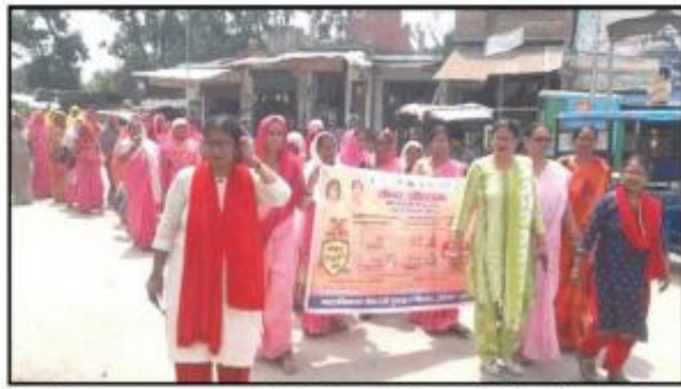
आयोजन संपन्न कराया गया जिसमें कुपोषित बच्चों को सुपोषित करने का