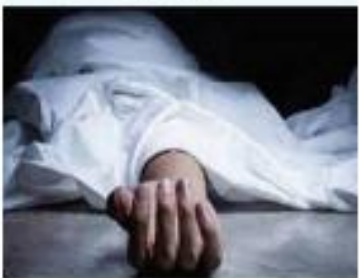
अमन लेखनी समाचार