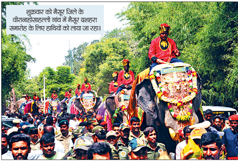
शुक्रवार को मैसूर जिले के वीरानाहाहाल्लो गांव में मैसूर दशहरा समारोह के लिए हाथियों को लाया जा रहा।