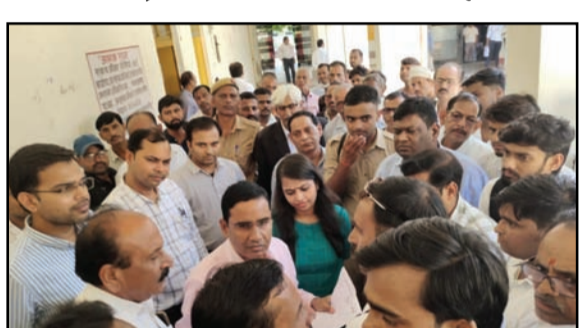
अमन लेखनी समाचार

गरौठा, झांसी । विगत रात्रि तहसील प्रशासन द्वारा अधिवक्ताओं के चैंबरों को बिना सूचना दिए जेसीबी मशीन द्वारा ध्वस्त किए जाने के विरोध में बुधवार को समस्त अधिवक्ताओं ने तहसीलदार एवं नायब तहसीलदार के खिलाफ जमकर नारेबाजी की तथा पैदल जूल्स निकालते हुए एडीएम को ज्ञापन दिया । अधिवक्ताओं ने हुए कहा कि तहसीलदार के वेतन से गिराए गए चैंबरों का नुकसान एव क्षतिपूर्ति कराई जाए । अधिवक्ताओं ने बताया की चैंबरों को