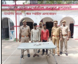
म0अ0सं0 314/2023 धारा 401भादवि व 3/25 आयुध अधिनियम पंजीकृत कर अभियुक्तगण को माननीय न्यायलय बहराइच रवाना किया गया।

नाजायज तमंचा व एक अदद जिन्दा कारतूस 315 बोर, एक अदद टार्च व एक लोहे की राड के साथ नईम की दुकान के पीछे वहाद ग्राम जमोग के पास से गिरफ्तार किया था। जिसके सम्बन्ध में थाना स्थानीय कर