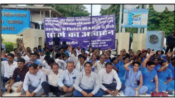
अमन लेखनी समाचार