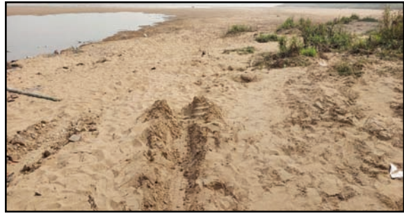
अमन लेखनी समाचार

डाला सोनभद्र- अवैध बालू खनन को लेकर जहां वन विभाग मुस्तैद है वहीं चोरी छिपे अवैध खनन कर्ताओं का हाँसला बुलंद है। दिन दहाड़े नदी के जगह - जगह क्षेत्रों में से बालू खनन चालू कर दिया गया। डाला वन रेंज के बाँडी व चुनियाटोला में इन दिनों बालू का अवैध खनन जोरो पर चालू है। खनन कर्ताओं के हाँसले बुलन्द में वन विभाग की सक्रियता देखने को मिलती