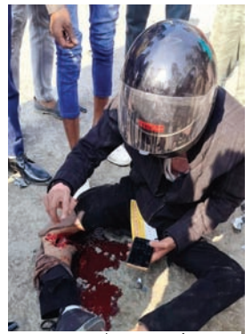
घायल अवस्था में सड़क पर बैठा छात्र

लखनऊ। बाइक से परीक्षा देने जा रहे छात्र को तेज रफ्तार पिकअप डाले ने सामने से रौंद दिया। जिससे सवार युवक गंभीर रूप से घायल हो गया राहगीरों की सूचना पर पहुंची पुलिस ने घायल अवस्था में युवक को आनन-फानन में अस्पताल पहुंचाया जहां चिकित्सकों ने प्राथमिक उपचार कर युवक को ट्रामा सेंटर रेफर कर दिया। पुलिस ने मौके से डाला सहित चालक को दबोच लिया।