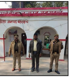
वर्ष को परगवा चौराहे से गिरफ्तार कर आवश्यक विधिक कार्यवाही कर गिरफ्तारशुदा अभियुक्त को मा0 न्यायालय सदर बहराइच रवाना किया जा रहा है।