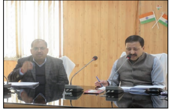
अमन लेखनी समाचार/उमेश दीक्षित

हमीरपुर। बैठक में जिलाधिकारी ने अटल भूजल योजना के अंतर्गत जनपद में सुमेरपुर मौदहा मुस्करा व सरीला विकासखंड की 57 ग्राम पंचायतों को चयनित किया गया है। इन चयनित ग्राम पंचायतों में योजना का प्रभावी ढंग से क्रियान्वयन कर जल संरक्षण को बढ़ावा देकर भूजल स्तर को बढ़ावा दिया जाना है। इसके अंतर्गत सभी संबंधित विभागों का सहयोग भी प्राप्त किया जाएगा। अटल भूजल योजना के संबंध में ग्राम विकास, उद्यान पंचायती राज, सिंचाई विभाग, भूमि संरक्षण सहित संबंधी विभाग की समीक्षा करते हुए जिलाधिकारी ने दिये गये लक्ष्य के सापेक्ष प्रगति समयबद्ध तरीके से शतप्रतिशत लक्ष्य पूर्ति करने के निर्देश दिए। जिलाधिकारी ने कहा कि भूगर्भ जल संरक्षण तथा संवर्धन हेतु अटल भूजल योजना एक महत्वपूर्ण योजना है इसके अंतर्गत शासनानदेश में दी गई व्यवस्था के अनुसार शासन की मंशा के अनुरूप कार्य किया जाए। इसमें किसी भी तरह की शिथिलता बर्दाश्त नहीं की जाएगी। इस मौके जिला पंचायत राज अधिकारी, जिला मत्स्य अधिकारी, अधिशाषी अभियन्ता सिंचाई विभाग सहित अन्य संबंधित विभागों के अधिकारी/कर्मचारी मौजूद रहे।