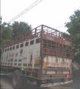
तार टुक की बाड़ी कब स्पर्श कर दे यह कहा नहीं जा सकता है, यदि कभी भी

गोरखपुर।सहजनवा ब्लॉक के विद्युत उपकेंद्र गंगटही द्वारा आपूर्ति की जाने वाली 11 हजार वोल्ट का तार ग्राम पंचायत मझौरा से इंडेन गैस एजेंसी की तरफ जाने वाली सम्पर्क सड़क पर बिजली का तार लटक रहा है, जिससे कभी भी हादसा हो सकता है। चूँकि इस सड़क से होकर प्रत्येक दिन इंडेन गैस एजेंसी पर भरा और खाली गैस सिलेंडर लेकर टुक का आना जाना लगा रहता है। यह 11 हजार वोल्ट का