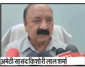
अमेठी सांसद किशोरी लाल शर्मा

अमेठी संजय गांधी अस्पताल में कैंसर विभाग का उद्घाटन 31 अगस्त को अमेठी सांसद द्वारा किया जाएगा। 2 अगस्त से कैंसर रोगियों का इलाज होना शुरू हो जाएगा। अस्पताल प्रशासन इसके लिए एक अलग यूनिट खोलने की तैयारियां पूरी की जा रही हैं। वीते कुछ माह पूर्व हृदय रोग से संबंधित एक विभाग शुरू कर हृदय रोगियों का सफल इलाज शुरू कर दिया है। इसकी सफलता से उत्साहित अस्पताल प्रशासन एक कैंसर यूनिट की स्थापना की तैयारी में जुट गया है। संजय