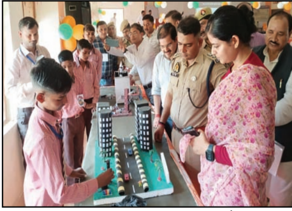
द्वारा प्रतिभाग किया गया। चंद्रयान 3, रोबोट, ट्रांसफार्मर, कंप्यूटर, संधनन, हाइड्रोलिक लिफ्ट, स्मार्ट हाउस, जल