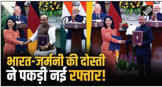
भारत-जर्मनी की दोस्ती ने पकड़ी नई रफ्तार!

नई दिल्ली, प्रधानमंत्री नरेन्द्र मोदी ने जर्मन चांसलर ओलाफ शोल्ट्स से शुक्रवार को मुलाकात की और उनसे भारत-जर्मनी की दोस्ती को गति देने वाले विभिन्न मुद्दों पर चर्चा की। इस दौरान भारत और जर्मनी ने दिल्ली के हैदराबाद हाउस में प्रधानमंत्री नरेन्द्र मोदी और जर्मन चांसलर ओलाफ शोल्ट्स की उपस्थिति में समझौता ज्ञापनों और समझौतों का आदान-प्रदान किया। नवाचार और प्रौद्योगिकी पर रोडमैप और रोजगार और श्रम के क्षेत्र में एक संयुक्त घोषणापत्र पर समझौता ज्ञापन का आदान-प्रदान हुआ। इस दौरान मोदी ने कहा कि मैं चांसलर शोल्ट्स और उनके प्रतिनिधिमंडल का भारत में हार्दिक स्वागत करता हूँ। मुझे खुशी है कि हमें