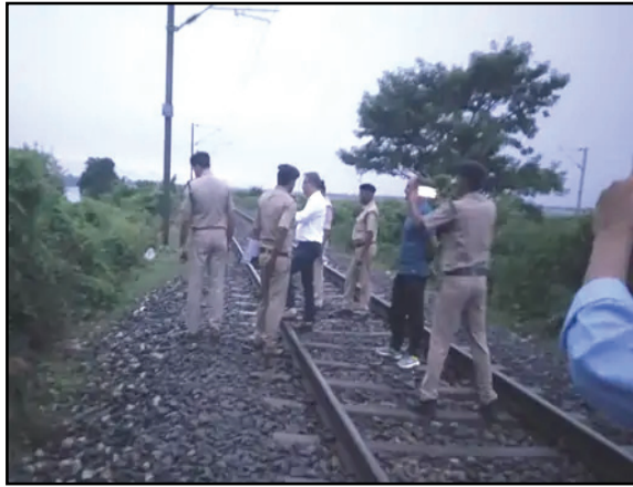
ट्रेन बकुलहा रेलवे स्टेशन से आगे बढ़ी कि मांडी पुल जो यूपी-बिहार को

बलिया, बलिया में ट्रेन पलटाने की साजिश हुई। बकुलहा-मांडी रेलवे स्टेशन के बीच पटरी पर पत्थर रख दिया गया। डाउन लाइन से आ रही लखनऊ-छपरा एक्सप्रेस ट्रेन के लोको पायलट की नजर पड़ी तो इमरजेंसी ब्रेक लगाकर ट्रेन रोक दी। बावजूद इसके पटरी पर रखा पत्थर ट्रेन के कैटल गार्ड से टकरा गया। हालांकि लोको पायलट ने सेफ्टी चेक करने के बाद ट्रेन को रवाना कर दिया। बलिया-छपरा रेल खण्ड के मध्य लखनऊ-छपरा डाउन एक्सप्रेस जा रही थी। रेलवे द्वारा प्राप्त सूचना के आधार पर करीब 10.25 बजे जैसे ही लखनऊ-छपरा एक्सप्रेस