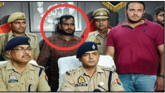
भवानी में एक परिवार के 4 लोगों की हत्या का आरोपी है। मोहननज थाना क्षेत्र में मुठभेड़ हुई है। इस पूरे मामले पर पुलिस ने जांच शुरू कर दी है।