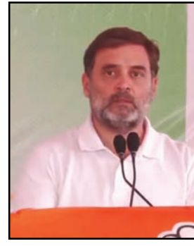
आरएसएस के लोगों के लिए खोखली

देश नहीं कर सका। इसके साथ ही राजनाथ सिंह ने जातिगत जनगणना को लेकर विश्व पर निशाना साधा। राजनाथ ने कहा कि हमारे नौजवान नेता राहुल गांधी हाथ में कुछ लाल लिए रहते हैं, कहते हैं कि संविधान है। जहां भी जाते हैं, उसे दिखाते हैं। वो कहते हैं कि जातिगत जनगणना कराकर रहूंगा। जातिगत जनगणना कराकर करोगे क्या? देश की जनता को गुमराह करके राजनीति नहीं की जानी चाहिए। इससे पहले राजनाथ सिंह ने कहा था कि विश्वसनीयता किसी भी राजनीतिक