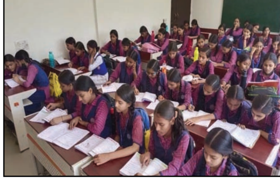
असर डाल सकता है।

वहीं 18,381 स्कूलों में स्मार्ट क्लासेस स्थापित की जा चुकी हैं और 880 ब्लॉक में सूचना प्रौद्योगिकी (आईसीटी) लैब्स भी बनाई गई हैं। बावजूद इसके, शिक्षक इन संसाधनों का भरपूर उपयोग नहीं कर पा रहे हैं, जो कि शिक्षा की गुणवत्ता पर प्रतिकूल