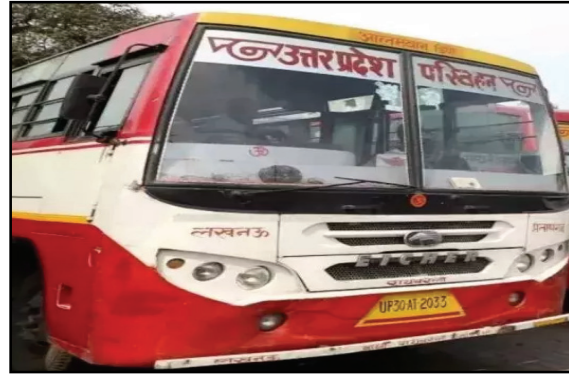
20 जिलों में सरकार लगाएगी रोजगार भेला, नोट कर ले तारीख