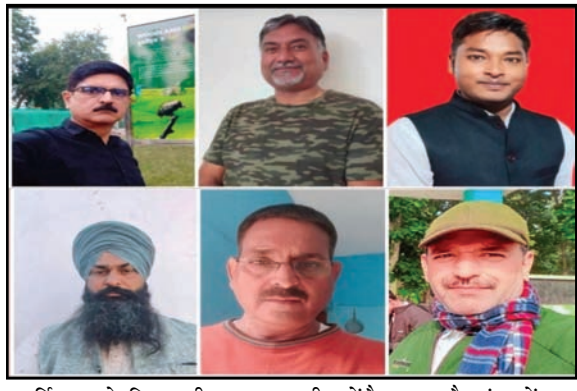
अमन लेखनी समाचार/मिथिलेश जायसवाल

मोतीपुर, बहराइच। देश विदेश में अपनी प्राकृतिक सुंदरता के लिए मशहूर कतर्नियाघाट वन्य जीव प्रभाग क्षेत्र में अभी तक रोडवेज बस की सेवा उपलब्ध नहीं हो सकी है जिससे देश-विदेश तथा राजधानी से आने वाले पर्यटकों को अपनी जेब ढीली करके कई वाहनों को बदलकर कतर्नियाघाट पहुंचना होता है जिससे पर्यटकों को काफी कठिनाई का सामना करना पड़ता है। दुधवा नेशनल पार्क में भले ही राजधानी लखनऊ से हेलीकॉप्टर सेवा शुरू की गई हो लेकिन सुप्रसिद्ध