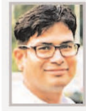
विचार ओपी चौधरी