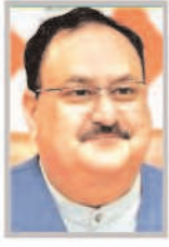
चिकित्सा सेवा जेपी नहा

लंबे समय से जेनेरिक दवाओं में अग्रणी देश होने के कारण 'विश्व की फ़ार्मसी' के रूप में प्रसिद्ध भारत का औषधि उद्योग अब पैमाने से नवाचार की ओर आगे बढ़ने के लिए तैयार है। प्रधानमंत्री नरेन्द्र मोदी के नेतृत्व में, भारत सरकार भविष्य के अनुरूप एक नीतिगत रूपरेखा को गति दे रही है, ताकि देश जेनेरिक दवाओं में अपनी मजबूत स्थिति बनाए रखते हुए इन उभरते क्षेत्रों में अधिक हिस्सेदारी प्राप्त कर सके। केंद्रीय बजट 2026-27 में रुपये 10,000 करोड़ के मिशन बायोफार्मा निर्माण शक्ति की घोषणा इस दिशा में एक निर्णायक कदम को रेखांकित करती है। यह अगले 8 से 10 वर्षों में भारत को बायोफार्मा नवाचार और उच्च मूल्य वाली चिकित्सा सेवाओं के वैश्विक केन्द्र बनाने के देश के संकल्प का संकेत देती है।