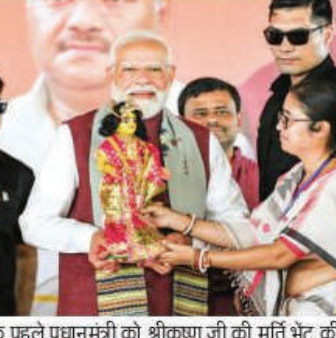
संघोधन के पहले प्रधानमंत्री को श्रीकृष्ण जी की मूर्ति भेंट की गई

उन्होंने कहा कि टीएमसी के विधायकों, मंत्रियों, स्थानीय नेताओं और उनके सिंडिकेट के खिलाफ इतना गुस्सा है कि टीएमसी कई शहरों में अपना खता भी नहीं खोल पाएगी। 15 साल पहले लोगों ने वामपंथियों के खिलाफ बिगुल फूँका था। जंगल राज के विरोध में बंगाल की जनता गली-गली, मोहल्ले-मोहल्ले में शंख फूँक रही है।