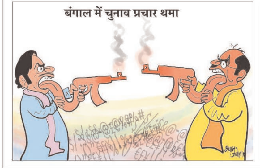
बंगाल में चुनाव प्रचार थमा