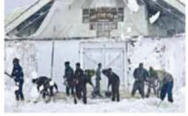
अमन लेखनी समाचार/नई दिल्ली,

रविवार की सुबह उत्तराखंड के कई जिलों में मौसम ने अचानक करवट ली और घने काले बादलों ने दिन को रात में तब्दील कर दिया। देहरादून में तड़के से ही मूसलाधार बारिश शुरू हो गई। नदी-नाले उफान पर आ गए, कई मोहल्लों में पानी भर गया और जगह-जगह ओले गिरने से लोग घरों में दुबकने को मजबूर हो गए। गंगोत्री नेशनल हाईवे पर मनेरी के पास पहाड़ी से अचानक इतने जोर से पानी का रेला आया कि देखते ही देखते वहां एक विशाल झरना बन गया। राजमार्ग पर चल रहे राहगीर और वाहन चालक हक्के-बक्के रह गए। लोग जान बचाकर भागे। हाईवे कुछ देर के लिए अवरूद्ध हो गया और यातायात थम गया।