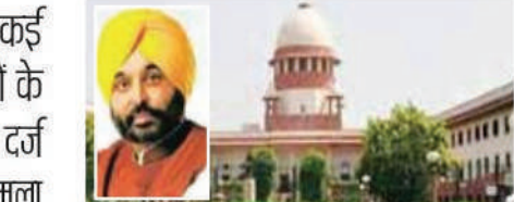
आप के कई नेताओं के खिलाफ दर्ज था मामला

अमन लेखनी समाचार/नई दिल्ली, पुलिस से झड़प और डीसी के आदेशों का उल्लंघन करने के मामले में चंडीगढ़ प्रशासन पंजाब के मुख्यमंत्री भगवंत मान समेत कई नेताओं के खिलाफ सुप्रीम कोर्ट पहुंच गया है। 6 साल पहले भगवंत मान, हरपाल चीमा, अमन अरोड़ा समेत आम आदमी पार्टी के दर्जनों नेताओं के खिलाफ चंडीगढ़ पुलिस ने केस दर्ज किया था। पिछले साल इन नेताओं को पंजाब-हरियाणा हाईकोर्ट से राहत मिल गई थी।