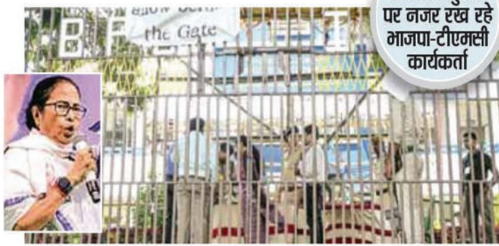
स्ट्रांग रूम की सुरक्षा पर नजर रख रहे भाजपा-टीएमसी कार्यकर्ता

पश्चिम बंगाल की मुख्यमंत्री ममता बेनर्जी के भवानीपुर विधानसभा क्षेत्र के मतगणना केंद्र के बाहर रविवार को हंगामा हुआ। टीएमसी के कार्यकर्ताओं ने आरोप लगाया कि भाजपा के झंडे वाले 2वाहनों को उस परिसर में प्रवेश दिया गया, जहां इलेक्ट्रॉनिक वोटिंग मशीन (ईवीएम) रखी गई है। यह घटना उस समय हुई, जब इससे एक दिन पहले ममता ने सखावत बालिका विद्यालय में स्थित इस मतगणना केंद्र के बाहर 4घंटे तक धरना दिया। उन्होंने स्ट्रांग रूम में अनधिकृतिक लोगों के प्रवेश का आरोप लगाया था। मतदान खत्म होने के बाद अब बंगाल में सत्तारूढ़ टीएमसी और भाजपा के बीच सत्ता को लेकर तनाव बढ़ गया है। दोनों दलों के नेता और कार्यकर्ता राज्यभर में स्ट्रांग रूम की सुरक्षा पर नजर रखे हुए हैं, जहां उम्मीदवारों की किस्मत ईवीएम में बंद है। भारी जीत का भरोसा जताने के बावजूद ममता ने कई बार मतगणना में गड़बड़ी और ईवीएम से छेड़छाड़ की आशंका जताई है।