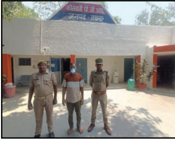
थी। शादी के बाद से ही उसे दहेज के लिए प्रताड़ित किया जा रहा था।