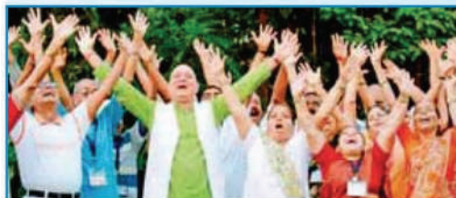
चंद्र सेकेंड के बाद यह कुदरती रूप ले लेती है। खेज का पैटर्न बनता है। खेज, अस्सी और खनवटी हंसी में आंतर नहीं कर पाता। आर्टिफिशियल हंसी को वास्तविक इमोशनल सिग्नल मानता है और मानसिक परेशानियों को भुगाने में मदद करता है।

कर्मिण दूर में हास्य का इस्तेमाल थेरेपेटिक टूल या स्ट्रक्चर थेरेपी की तरह बड़े पैमाने पर किया जा रहा है। कई जगह लाफ्टर क्लब संचालित होते हैं, जिनमें मानसिक स्वास्थ्य, खासकर तनाव प्रबंधन के लिए लाफ्टर-थेरेपी या लाफ्टर-योग काया जाता है। इसमें कराई जाने वाली लाफिंग-एक्सरसाइज आर्टिफिशियल हंसी होती है, जिसमें व्यक्ति को बिना किसी कारण के जबरदस्ती हंसाया जाता है। शुरू में भले ही यह हंसी जबरन होती है, लेकिन चंद्र सेकेंड के बाद यह कुदरती रूप ले लेती है। खेज का पैटर्न बनता है। खेज, अस्सी और खनवटी हंसी में आंतर नहीं कर पाता। आर्टिफिशियल हंसी को वास्तविक इमोशनल सिग्नल मानता है और मानसिक परेशानियों को भुगाने में मदद करता है।