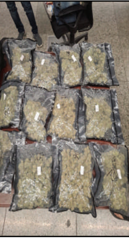
पर अधिकारियों ने उक्त यात्री के चेक-इन बैगैज की गहन तलाशी ली। जांच

लखनऊ। चौधरी चरण सिंह अंतर्राष्ट्रीय हवाई अड्डा पर एयर इंटेलिजेंस यूनिट (एआईयू) ने गुरुवार को बड़ी कार्रवाई करते हुए बैंकोंक से आए एक यात्री के पास से करीब 2.859 किलोग्राम हाइड्रोपोनिक वीड (गांजा) बरामद किया। बरामद मादक पदार्थ की अंतरराष्ट्रीय बाजार में अनुमानित कीमत करीब 2.86 करोड़ रुपये बताई जा रही है। जानकारी के मुताबिक खुफिया सूचना के आधार पर एआईयू टीम ने बैंकोंक से रात 10:35 बजे लखनऊ पहुंचने वाली एयर एशिया की फ्लाइट संख्या 830-146 से बुधवार रात लखनऊ पहुंचे एक यात्री को सुरक्षा जांच के दौरान ग्रीन चैनल पर रोका। जहां सदेह होने