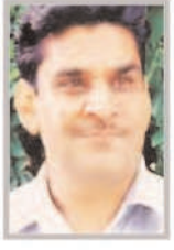
चुनाव परिणाम डॉ. घनश्याम बादल