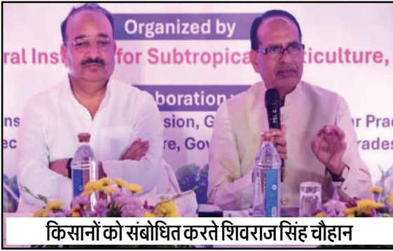
किसानों को संबोधित करते शिवराज सिंह चौहान

फलों का उत्पादन तो बड़े पैमाने पर होता है, लेकिन निर्यात अभी अपेक्षाकृत कम है। इसे बढ़ाने के लिए केंद्र सरकार विशेष टास्क फोर्स गठित करेगी, जो पौध तैयार होने से लेकर फल के निर्यात तक पूरी श्रृंखला पर काम करेगी। उन्होंने घोषणा की कि देशभर में क्लीन प्लॉट सेंटर स्थापित किए जाएंगे, जिनमें उत्तर प्रदेश को भी