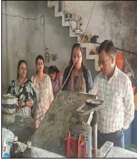
आइसक्रीम से कुल्फी घोल का नमूना लिया गया, जिसे जांच के लिए प्रयोगशाला भेजा गया है। जांच टीम

अभियान के तहत, आवास विकास स्थित खुशी आइसक्रीम फैक्ट्री में भारी गंदगी पाई गई। निरीक्षण के दौरान निर्माण स्थल पर साफ-सफाई के मानकों का पालन नहीं हो रहा था। खाद्य पदार्थ खुले में रखे मिले और निर्माण प्रक्रिया भी अस्वच्छ परिस्थितियों में चल रही थी। इस गंभीर उल्लंघन पर विभाग ने फैक्ट्री संचालक को कारोबार बंद करने का नोटिस जारी किया। इसी कड़ी में, न्यू दीपिका