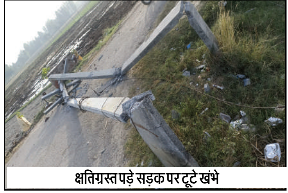
क्षतिग्रस्त पड़े सड़क पर टूटे खंभे

लखनऊ। रहीमाबाद थाना क्षेत्र के उतरेहटा गांव के पास शनिवार देर रात खनन में लगे तेज रफ्तार डंपर ने बिजली के चार पोलों में जोरदार टक्कर मार दी। हादसे के बाद पोल और तार सड़क पर गिर पड़े, जिससे क्षेत्र के सी से अधिक घरों की बिजली आपूर्ति पूरी तरह ठप हो गई। करीब 12 घंटे तक बिजली न आने से ग्रामीणों को भीषण गर्मी में भारी परेशानी झेलनी पड़ी। रविवार सुबह तक सड़क के बीच टूटे पोल और लटकते तार पड़े रहने से हादसे का खतरा बना रहा। नाराज ग्रामीणों ने प्रदर्शन कर प्रशासन और खनन कार्य में लगे लोगों के खिलाफ आक्रोश जताया। ग्रामीणों का कहना था कि खनन में लगे डंपर तेज रफ्तार से दौड़ते हैं, जिससे आए दिन हादसे का खतरा बना रहता है। उनका कहना था कि यदि रात में कोई राहगीर