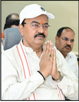
माइक्रोप्लान तैयार किया जाए। ग्रामवासियों के साथ पर्यावरण संरक्षण पर गोष्ठियां आयोजित हों। उन्होंने ह्यूमनाली नदीतट संरक्षण अभियानह को प्रभावी ढंग से संचालित करने तथा

विकास विभाग द्वारा वृक्षारोपण के क्षेत्र में उल्लेखनीय कार्य किया गया था तथा जनपदों ने निर्धारित लक्ष्य से अधिक पौधारोपण कर सराहनीय उपलब्धि हासिल की थी। इसके लिए सभी अधिकारी एवं कर्मचारी बहाई की पात्र हैं। उन्होंने कहा कि गत वर्ष की भांति इस वर्ष भी ग्राम्य विकास विभाग का लक्ष्य निर्धारित किया गया है। इस लक्ष्य की प्राप्ति के लिए योजनाबद्ध एवं समयबद्ध कार्यवाही सुनिश्चित की जाए। उप मुख्यमंत्री ने निर्देश दिये कि प्रत्येक ग्राम पंचायत में वृक्षारोपण हेतु