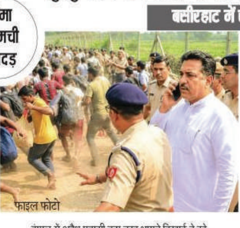
बंगाल में अवैध प्रवासी इस तरह भागते दिखाई दे रहे

पश्चिम बंगाल सरकार ने अवैध घुसपैठियों की पहचान और कार्रवाई के लिए राज्यभर में 11 होल्डिंग सेंटर स्थापित किए हैं। आधिकारिक जानकारी के अनुसार, इन केंद्रों में फिलहाल 335 संदिग्ध लोगों को रखा गया है। अधिकारियों ने बताया कि ये सभी कार्रवाई राज्य की 'डिटेक्ट, डिलीट और डिपोर्ट' नीति के तहत की जा रही है, जिसका उद्देश्य अवैध रूप से रह रहे विदेशी नागरिकों को पहचान कर उन्हें वापस भेजना है। सरकारी आंकड़ों के अनुसार, इन केंद्रों में कुल 335 लोग मौजूद हैं, जिनमें 148 पुरुष, 99 महिलाएं और 88 बच्चे शामिल हैं। इन सभी की पहचान और दस्तावेजों की जांच की प्रक्रिया जारी है। राज्य गृह विभाग की ओर से जारी आदेश में जिला प्रशासन को निर्देश दिया गया है कि विदेशी नागरिकों को तब तक रखने के लिए टांचा तैयार किया जाए।