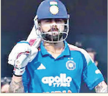
मांसपेशियों से जुड़ी एक दुर्लभ चोट है जो नर्सों के उस जाल को प्रभावित करती है जो घुटने के ठीक नीचे मांसपेशियों को पिंडली की हड्डी के अंदरूनी हिस्से से जोड़ती है। अपनी शानदार फिटनेस के लिए मशहूर 37 वर्षीय कोहली ने आईपीएल में शानदार प्रदर्शन किया था। कोहली ने गुजरात टाइटंस के खिलाफ

नवी दिल्ली। भारत के सुपरस्टार बल्लेबाज विराट कोहली हाल में समाप्त हुए आईपीएल के दौरान मांसपेशियों (हैमस्ट्रिंग) में खिंचाव के कारण अफगानिस्तान के खिलाफ 13 जून से शुरू हो रही वनडे श्रृंखला से बर्खास्तित हो गए। तीन मैचों की श्रृंखला का पहला मैच 13 जून को धर्मशाला में खेला जाएगा। कोहली को रिवार को अहमदाबाद में खेले गए आईपीएल फाइनल के दौरान चोट लगी थी। उनकी टीम रॉयल चैलेंजर्स बंगलुरु (आरसीबी) ने यह मैच जीत कर लगातार दूसरी बार आईपीएल का खिताब जीता था। भारतीय क्रिकेट बोर्ड (बीसीसीआई) के एक सूत्र ने पीटीआई को बताया, कोहली मांसपेशियों में खिंचाव के कारण वनडे श्रृंखला से बाहर हो गए हैं। फाइनल के दौरान उन्हें चोट लगी थी। स्कैन से पता चला है कि उनकी डिस्टल सेमीमैम्ब्रेनस टेंडन (घुटने के पीछे की मांसपेशियों) फट गई है। डिस्टल सेमीमैम्ब्रेनस टेंडन का फटना