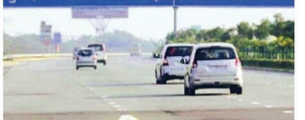
यमुना एक्सप्रेसवे पर आपका स्वागत है। Welcome To Yamuna E

यमुना एक्सप्रेस-वे पर यातायात व्यवस्था को सुरक्षित, सुचारु और बाधा रहित बनाए रखने के लिए गौतमबुद्धनगर पुलिस कमिश्नरेंट ने बड़ा कदम उठाया है। यमुना एक्सप्रेस-वे के गौतमबुद्धनगर क्षेत्र के अंतर्गत आने वाले 0 किलोमीटर से 41 किलोमीटर तक के हिस्से को 'नो प्रोटेस्ट जोन' घोषित कर दिया गया है। यह निर्णय इलाहाबाद हाई कोर्ट के 22 मई के निर्देशों के अनुपालन में लिया गया है। नए आदेश के तहत एक्सप्रेस-वे के इस क्षेत्र में किसी भी राजनीतिक, गैर-राजनीतिक या अन्य संगठन द्वारा धरना-प्रदर्शन, विरोध प्रदर्शन, रैली अथवा अंदोलन आयोजित करने की अनुमति नहीं होगी।