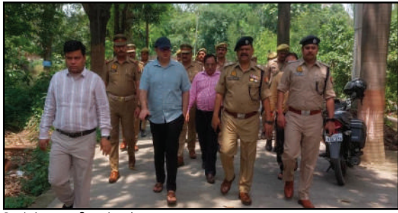
जिले के 11 परीक्षा केन्द्रों पर सम्पन्न होगी भर्ती परीक्षा अमन लेखनी समाचार

बहराइच। उत्तर प्रदेश पुलिस भर्ती एवं प्रोन्नति बोर्ड लखनऊ द्वारा आयोजित उ.प्र. पुलिस में आरक्षी नागरिक पुलिस एवं सप्तकक्ष पदों पर सीधी भर्ती हेतु 08 से 10 जून 2026 तक दो पालियों में सम्पन्न होने वाली की लिखित परीक्षा-2025 हेतु जनपद में 11 शिक्षण संस्थाओं को परीक्षा केन्द्र बनाया गया है। भर्ती परीक्षा को शासन की मंशानुसार स्वतंत्र, निष्पक्ष