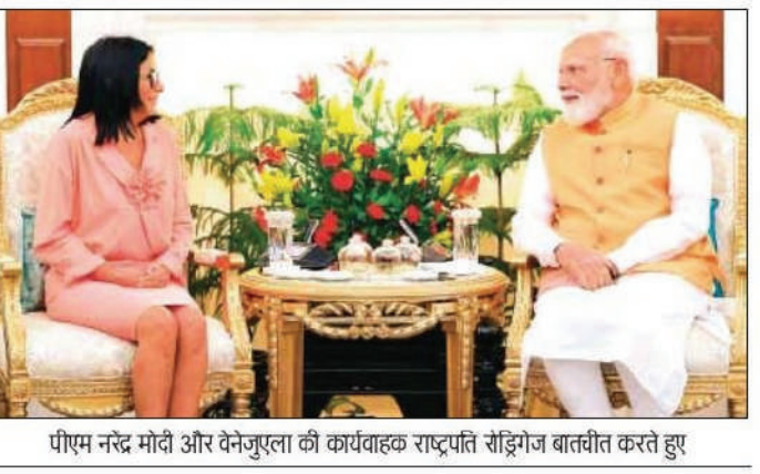
पीएम नरेंद्र मोदी और वेनेजुएला की कार्यवाहक राष्ट्रपति रोड्रिगेज बातचीत करते हुए