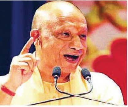
कक्षा 12 तक के विद्यार्थियों को पढ़ाई के साथ-साथ कौशल प्रशिक्षण की ट्रेनिंग भी दी जाएगी। छात्रों

यूपी में 1300 माध्यमिक स्कूलों में छात्रों के हित में योगी सरकार बड़ा काम करने जा रही है। उत्तर प्रदेश सरकार ने स्कूलों में प्रोजेक्ट प्रवीण शुरू करने जा रही है। छात्रों को तीन महीने से लेकर एक वर्ष तक की ट्रेनिंग दी जाएगी। प्रोजेक्ट प्रवीण पर सरकार अब 500 करोड़ रूपए खर्च करेगी। तीन महीने से लेकर एक वर्ष तक के ट्रेनिंग कोर्स चलाए जाएंगे।