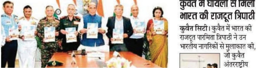
डेलीगेशन ऑफ फाइनेशियल पावर्स जारी करते रक्षा मंत्री राजनाथ सिंह

वेनेजुएला की कार्यवाहक राष्ट्रपति डेलसी रोड्रिगेज ने राजघाट पहुंचकर महात्मा गांधी को श्रद्धांजलि अर्पित की। उन्होंने बापू की स्थायी विरासत को नमन करते हुए कहा कि गांधी के आदर्श आज भी भारत-वेनेजुएला संबंधों के लिए प्रासंगिक हैं। विदेश मंत्रालय ने एक्स पर लिखा कि 'बापू की स्थायी विरासत को नमन' करते हुए रोड्रिगेज ने राजघाट पर श्रद्धांजलि दी।