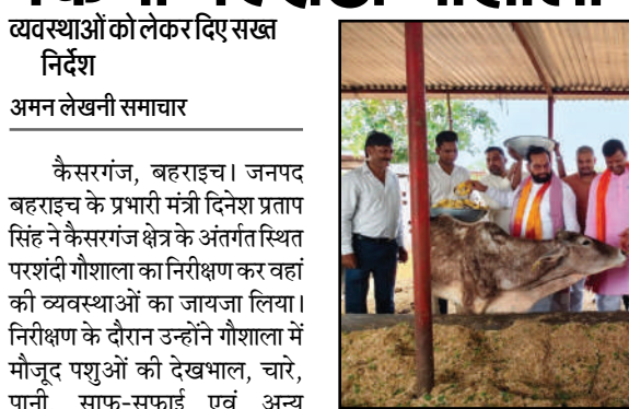
किसी प्रकार की कमी बर्दाश्त नहीं की जाएगी। निरीक्षण के दौरान प्रभारी मंत्री ने गौशाला में रह रहे गौवंशों के स्वास्थ्य एवं सुरक्षा संबंधी व्यवस्थाओं का भी अवलोकन किया और संबंधित अधिकारियों को नियमित निगरानी बनाए रखने के निर्देश दिए। उन्होंने कहा कि गौशाला में पर्याप्त मात्रा में हरा चारा, भूसा, पानी एवं दवाइयों की उपलब्धता सुनिश्चित की जाए ताकि