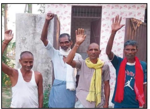
सरकार के ग्रामोत्थान की मंशा अधूरी ही रह जाती है। भारत स्वच्छता मिशन अंतर्गत लाखों की लागत से बनाए गए इस सुलभ शौचालय का कोई अर्थ तथा महत्व नहीं रह जाता है। ग्रामीणों ने बताया कि लाखों की लागत से निर्मित इस सार्वजनिक शौचालय में न तो पानी की कोई व्यवस्था है और न ही साफ-सफाई की। यह एक वर्ष से पूरी तरह से अनुपयोगी होकर बंद पड़ा है। इस सम्बन्ध में खंड विकास अधिकारी शिवपुर से बातों की गईं तो उन्होंने बताया जांच करवाई जाएगी तथा सार्वजनिक शौचालय की व्यवस्थाओं को जल्द ही सही करवाया जाएगा।

शिवपुर, बहराइच। बहराइच जिले के शिवपुर विकासखंड के अंतर्गत ग्राम पंचायत नेवादा पुरे कस्बाती के गद्दीघाट स्थित घंटाबाबा आश्रम परिसर में लाखों रुपये की लागत से बनाया गया एक सार्वजनिक शौचालय पिछले एक साल से बंद पड़ा है। इसकी बदहाली के कारण स्थानीय ग्रामीणों को भारी परेशानी का सामना करना पड़ रहा है। ग्रामीणों ने बताया कि दर्जनों ग्राम पंचायतों से होकर गद्दीघाट ककरी मार्ग इसी आश्रम के रास्ते से होकर गुजरता है, जिस पर हजारों हजार राहगीर निकलते हैं। वही आश्रम में काफी श्रद्धालुओं की भीड़ रहती है जो पूजा पाठ करने हेतु आते हैं। बीते वर्ष पूर्व से सार्वजनिक शौचालय में न तो पानी आता है ना ही साफ सफाई की व्यवस्था है। ऐसे में डबल इंजन