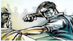
अमन लेखनी समाचार

ग्राहक सेवा को लेकर ढाबे पर कर्मचारियों के बीच जमकर हुई मारपीट