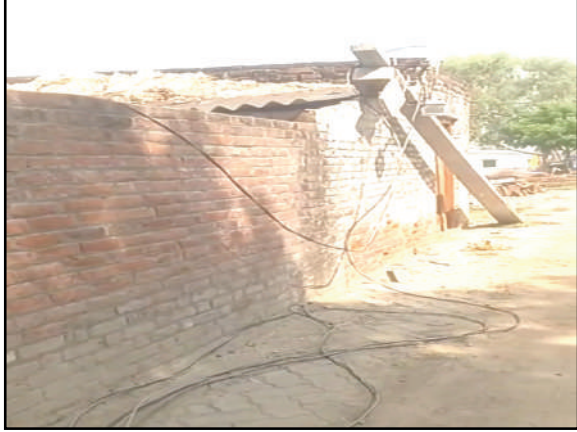
अमन लेखनी समाचार

बांगरमऊ, उन्नाव। क्षेत्र में रात के समय लगातार होने वाले खनन कार्य में लगी जे सी बी की गर्जना व ट्रैक्टर ट्रालियों की धमाचौकड़ी से ग्रामीणों की नींद व चैन छिन्ता दिख रहा इसी खनन में लगे ट्रैक्टर की टक्कर से एक विद्युत पोल धराशाई हो गया जिससे चार दिनों से एक गांव की बत्ती गुल पड़ी हुई है किंतु तहसील प्रशासन की कार्यवाही ऊंट के मुंह में जीरा साबित होती दिख रही है।