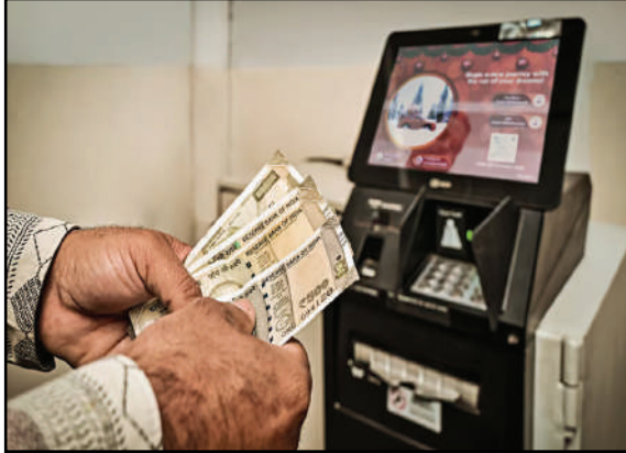
अमन लेखनी समाचार