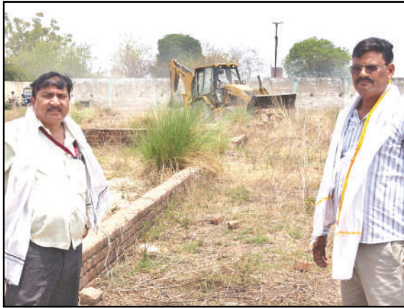
अमन लेखनी समाचार

उन्नाव। शासन के भू-माफिया मुक्त अभियान के तहत जिला प्रशासन ने शुक्रवार को बड़ी कार्रवाई करते हुए तहसील सदर के ग्राम कटरी पीपरखेड़ा में सरकारी जमीन पर किए गए अवैध कब्जे को ध्वस्त कर दिया। सहायक अभिलेखागार अधिकारी के नेतृत्व में पहुंची राजस्व और पुलिस की संयुक्त टीम ने बुलडोजर से पक्के निर्माण गिराकर 0.7675 हेक्टेयर जमीन कब्जा मुक्त कराई।