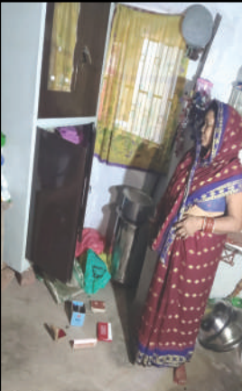
अमन लेखनी समाचार

बीघापुर, उन्नाव। कोतवाली क्षेत्र में सिकंदरपुर कर्ण ब्लाक के अकबलपुर गांव में गुरुवार रात चोरों ने एक घर को निशाान बनाते हुए लाखों रुपये के जेवरात और नगदी पर हाथ साफ कर दिया। छत के रास्ते घर में दाखिल हुए चोर लगभग 50 ग्राम सोना, आधा किलो चांदी के जेवरात तथा डेढ़ लाख रुपये नकद चोरी कर ले गए। सूचना पर पहुंची पुलिस ने घटनास्थल का निरीक्षण कर जांच शुरू कर दी है।