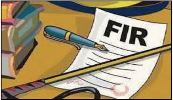
अमन लेखनी समाचार

सुमेरपुर, उन्नाव। थाना बिहार अन्तर्गत पुत्री के गुम हो जाने पर पिता द्वारा पुलिस को तहरीर दिए जाने पर पुलिस ने मुकदमा दर्ज कर लिया है। थाना बिहार के एक गांव से पिता ने पुलिस को तहरीर देकर बताया कि उसकी 19 वर्षीय पुत्री अपने घर से बिहार जाने के लिए