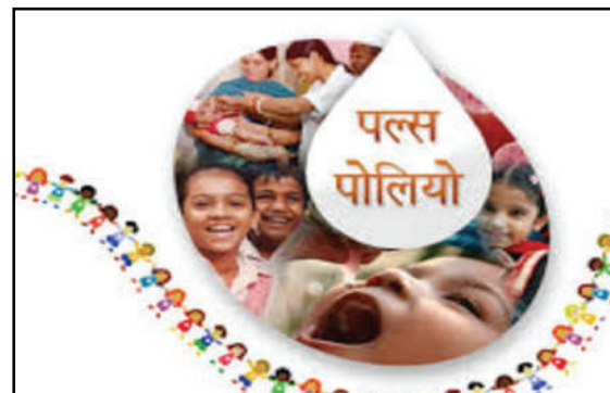
अमन लेखनी समाचार