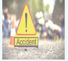
अमन लेखनी समाचार

अनियंत्रित कार पलटी चार बच्चों समेत एक परिवार के तीन लोग घायल