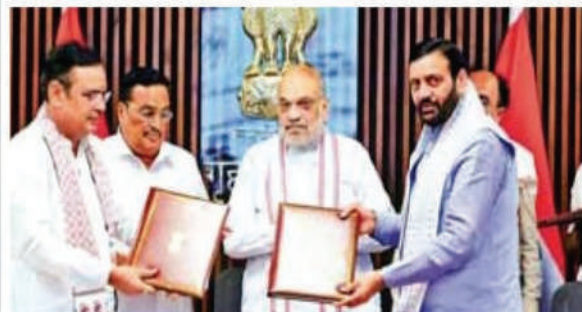
अमित शाह उपस्थिति में सीएम नायब सैनी और सीएम भजनलाल ने किया एमओयू

अमित शाह ने कहा कि यह समझौता प्रधानमंत्री मोदी द्वारा दिए गए सहकारी संघवाद के मंत्र का एक उत्कृष्ट उदाहरण है। साथ ही यह समझौता इस बात का भी उदाहरण है कि अगर राज्य सहकारी संघवाद की सोच को आगे बढ़ाएं तो तीन दशक पुरानी समस्या भी सरलता से सुलझ सकती है।