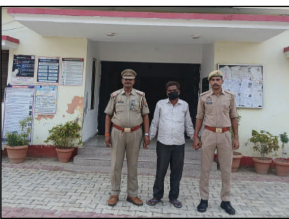
अमन लेखनी समाचार