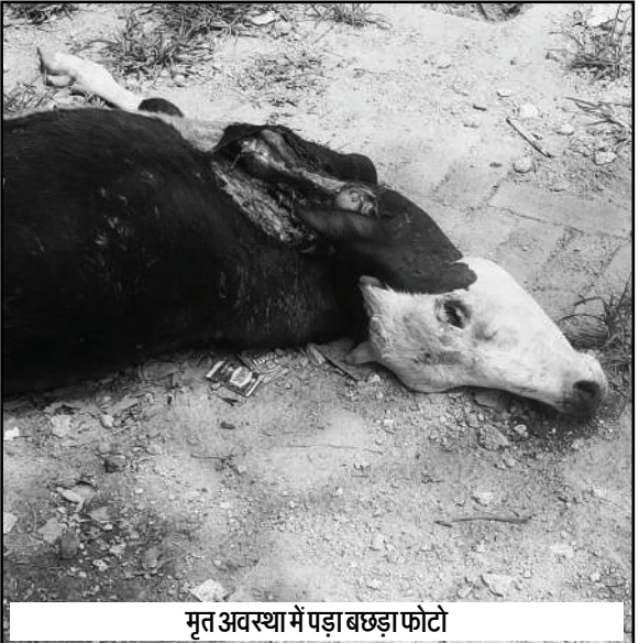
मृत अवस्था में पड़ा बछड़ा फोटो