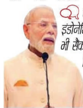
लोकतंत्र और साझा संस्कृति मजबूत रिश्तों का प्रतीक