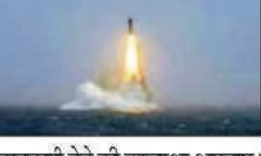
जानकारी देने की व्यवस्था अपनाए। चीन पी-5 का सदस्य है। चीन ने सोमवार को प्रशांत महासागर में अपनी एक परमाणु-संचालित पनडुब्बी से 'डमी' हथियार से लैस लंबी दूरी की रणनीतिक मिसाइल का सफल परीक्षण किया था। चीन ने कहा कि यह परीक्षण पीपुल्स लिबरेशन आर्मी नौसेना के वार्षिक प्रशिक्षण कार्यक्रम का निवर्तित हिस्सा है।

अमेरिका ने चीन द्वारा परमाणु हथियार ले जाने में सक्षम मिसाइल के परीक्षण पर चिंता व्यक्त की और अपने सहयोगी देशों की सुरक्षा के प्रति प्रतिबद्धता दोहराई। अमेरिकी विदेश मंत्रालय के प्रवक्ता टॉमी पिगॉट ने चीन से यह भी आग्रह किया कि वह हथियार निर्यात वार्ता में शामिल हो तथा संयुक्त राष्ट्र सुरक्षा परिषद के पांच स्थायी सदस्यों (पी-5) द्वारा किए गए वादों के अनुरूप अंतरमहाद्वीपीय दूरी (आईसीबीएम) की बैलिस्टिक मिसाइलों और अंतर्देशीय प्रक्षेपणों की