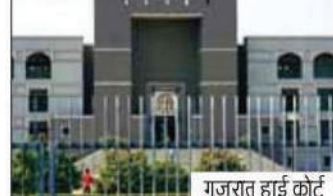
गुजरात हाई कोर्ट