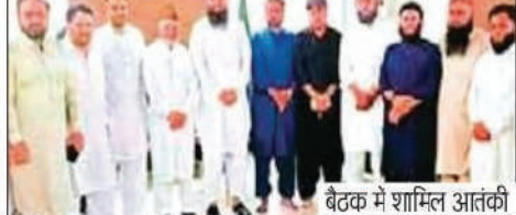
बैठक में शामिल आतंकी

गुजरात उच्च न्यायालय ने मंगलवार को 2008 के सीरियल ब्लास्ट मामले में विशेष अदालत के फैसले को बरकरार रखा। इस मामले में 56 लोग मारे गए थे और 246 घायल हुए थे। उच्च न्यायालय ने 38 दोषियों को मौत की सजा और 11 अन्य को आजीवन कारावास की सजा में राहत देने से इनकार कर दिया। अदालत ने राज्य सरकार को पीड़ितों को मुआवजा देने का