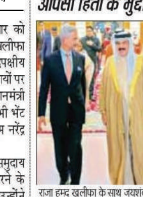
राजा हमद खलीफा के साथ जयशंकर

विदेश मंत्री एस. जयशंकर ने सोमवार को बहरीन के राजा हमद बिन ईसा अल खलीफा से मुलाकात कर भारत-बहरीन द्विपक्षीय साझेदारी को और मजबूत बनाने के उपायों पर चर्चा की। उन्होंने क्राउन प्रिंस एवं प्रधानमंत्री सलमान बिन हमद अल खलीफा से भी भेंट की और राष्ट्रपति द्रौपदी मुर्मू तथा पीएम नरेंद्र मोदी की शुभकामनाएं पहुंचाईं। जयशंकर ने बहरीन में भारतीय समुदाय की सुरक्षा और कल्याण सुनिश्चित करने के लिए राजा का आभार व्यक्त किया। उन्होंने कहा कि भारत-बहरीन संबंधों को आगे बढ़ाने में राजा का मार्गदर्शन अत्यंत महत्वपूर्ण है।