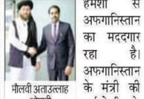
मौलवी अताउल्लाह ओमारी

विदेश मंत्रालय के प्रवक्ता रणधीर जायसवाल ने लिखा कि अफगानिस्तान के कृषि, सिंचाई और पशुपालन मंत्री मौलवी अताउल्लाह ओमारी के नई दिल्ली पहुंचने पर गर्मजोशी से स्वागत किया गया। उन्होंने लिखा कि आपसी हितों के मुद्दों पर सार्थक चर्चा की उम्मीद है। हाल ही में पाकिस्तान ने अफगानिस्तान पर हवाई हमले किए थे जिनकी भारत ने निंदा की थी और निर्दोष लोगों पर हुए हमलों के लिए मानवाधिकार संस्थाओं से पाकिस्तान को न्याय के कठघरे में खड़ा करने की अपील की थी।