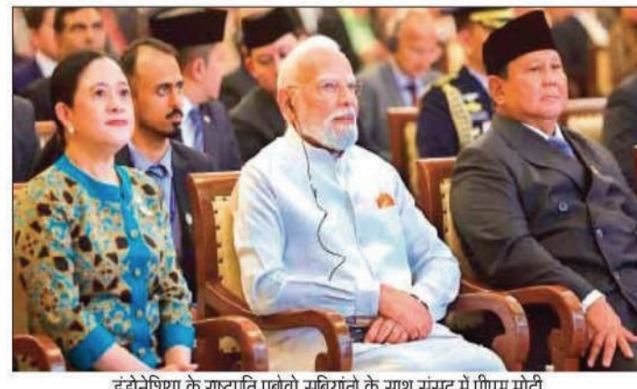
इंडोनेशिया के राष्ट्रपति प्रबोवो सुबियांतो के साथ संसद में पीएम मोदी

पीएम मोदी ने कहा कि भारत सबसे बड़ा लोकतंत्र है और इंडोनेशिया तीसरा सबसे बड़ा लोकतंत्र है। भारत की तरह इंडोनेशिया में भी सैकड़ों भाषाएं और परंपरा हैं। हम दोनों ने अपने लोकतंत्र में इस विविधता को अपनी एकता की नींव बना लिया है।