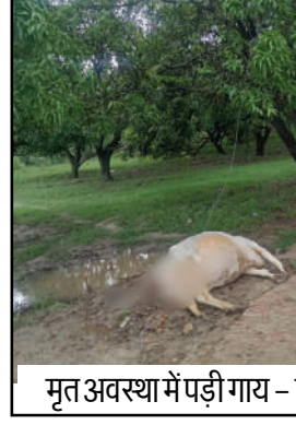
मृत अवस्था में पड़ी गाय - फोटो