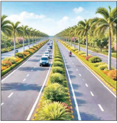
● पौधरोपण के लिए 2336 स्थल पर 11325 हेक्टेयर में पौधरोपण

प्रदेश के एक्सप्रेसवे के किनारे भी पौधरोपण किया जाएगा। इस बार विशेष रूप से गंगा एक्सप्रेसवे के किनारे पौधे लगाए जाएंगे। 594 किमी. लंबे गंगा एक्सप्रेसवे की दोनों पटरियों पर वन विभाग 500 हेक्टेयर क्षेत्र में 5.50 लाख पौधरोपण करेगा। दोनों पट्टी पर