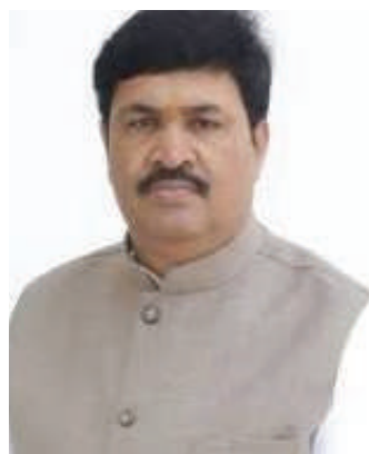
(लेखक हिंदी दैनिक अमन लेखनी के प्रधान संपादक हैं)

पद का नहीं, बल्कि व्यक्तित्व की गरिमा का सम्मान है। भारतीय जनता पार्टी के संगठनात्मक विस्तार में उनका योगदान अत्यंत महत्वपूर्ण रहा है। उन्होंने संगठन को केवल चुनौती मशीन नहीं बनने दिया, बल्कि उसे वैचारिक प्रतिबद्धता, कार्यकर्ता-आधारित संस्कृति और संवाद की स्वस्थ परंपरा और अधिक सुदृढ़ हुई। आज भारत जिस आत्मविश्वास के साथ वैश्विक मंच पर अपनी भूमिका निभा रहा है, उसके पीछे मजबूत राजनीतिक नेतृत्व, निर्णायक नीतियाँ और राष्ट्रीय सुरक्षा के प्रति स्पष्ट दृष्टिकोण है। राजनाथ सिंह ने सदैव इस सिद्धांत का समर्थन किया कि शांति की रक्षा वही राष्ट्र प्रभावी ढंग से कर सकता है जिसकी सुरक्षा व्यवस्था सशक्त, आधुनिक और आत्मनिर्भर हो। यही दृष्टि भारत की वर्तमान रक्षा नीति में स्पष्ट रूप से परिलक्षित होती है। उनका सार्वजनिक जीवन यह भी सिखाता है कि राजनीति का वास्तविक वैभव सत्ता की चमक में नहीं, बल्कि चरित्र की उज्वलता में निहित होता है। विनम्रता, सादगी, अनुशासन, शुचिता और राष्ट्र के प्रति अटूट समर्पण—ये वे मूल्य हैं जिन्होंने उन्हें करोड़ों भारतीयों के विश्वास का पात्र बनाया है। वे उन नेताओं में हैं जिनकी उपस्थिति लोकतांत्रिक विमर्श को संयम, संतुलन और सकारात्मक दिशा प्रदान करती है। राष्ट्र आज उनके जन्मदिन पर केवल शुभकामनाएँ ही नहीं देता, बल्कि उनके दीर्घ सार्वजनिक जीवन से प्रेरणा भी ग्रहण करता है।