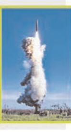
चीन की सेना ने सोमवार को दक्षिण प्रशांत महासागर में अपनी परमाणु संचालित पनडुब्बी से लंबी दूरी तक प्रहार करने में सक्षम बैलिस्टिक मिसाइल का परीक्षण किया।

चीन की सेना ने सोमवार को दक्षिण प्रशांत महासागर में अपनी परमाणु संचालित पनडुब्बी से लंबी दूरी तक प्रहार करने में सक्षम बैलिस्टिक मिसाइल का परीक्षण किया। कई देशों ने इसका विरोध करते हुए चिंता व्यक्त की है। सरकारी समाचार एजेंसी 'शिन्हुआ' की खबर के अनुसार, मिसाइल का प्रक्षेपण दोपहर 12 बजकर एक मिनट पर किया गया और यह एक 'उम्मी' हथियार से लैस थी। चीन ने करीब दो वर्ष पहले प्रशांत महासागर में मिसाइल परीक्षण किया था, तब एक 'उम्मी' हथियार से लैस अंतरमहाद्वीपीय बैलिस्टिक मिसाइल दागी गई थी। 'शिन्हुआ' की खबर में कहा गया कि यह प्रक्षेपण नियमित वार्षिक प्रशिक्षण का हिस्सा है।