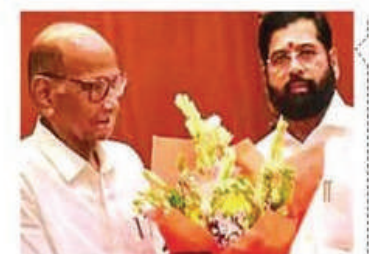
अमन लेखनी समाचार/मुंबई,

एनसीपी (एसपी) के अध्यक्ष शरद पवार के विधान भवन परिसर में महाराष्ट्र के उपमुख्यमंत्री एकनाथ शिंदे से मुलाकात पर बवाल मच गया है। शिवसेना यूबीटी के सांसद संजय राउत ने इस पर शरद पवार पर सवाल खड़े किए हैं। राउत ने कहा कि उनकी पार्टी शिंदे के ऑफिस में पवार की मीटिंग से परेशान और दुखी है और ऐसी हरकतों से उनके जैसे सीनियर लीडर पर भरोसा कम होता है। उन्होंने कहा कि यह मीटिंग गद्दारी की बड़ाई करने जैसा था। शरद की पार्टी ने राउत पर कड़े शब्दों में पलटवार करते हुए उन पर डबल स्टैंडर्ड अपनाने का आरोप लगाया और उन्हें याद दिलाया कि पवार की उनसे और शिवसेना (यूबीटी) चीफ उद्भव ठाकरे से हुई मीटिंग्स को पहले पॉलिटिकल स्टेट्समैनशिप कहा गया था। एक मीटिंग से क्यों घबरा रहे हैं?