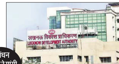
निबंधन विभाग ने मांगी फाइलें

लखनऊ। लखनऊ विकास प्राधिकरण (एलडीए) द्वारा निजी एजेंसियों को लीज और किराये पर दी गई करीब 2,000 व्यावसायिक एवं अन्य संपत्तियां अब स्टाम्प शुल्क जांच के दायरे में आ गई हैं। निबंधन विभाग को आशंका है कि इन संपत्तियों के अनुबंधों में नियमानुसार स्टाम्प शुल्क का भुगतान नहीं किया गया है। इसे देखते हुए सहायक आयुक्त स्टाम्प (द्वितीय) ने एलडीए उपाध्यक्ष को पत्र भेजकर सभी संबंधित पत्रावलिियां उपलब्ध कराने के निर्देश दिए हैं।