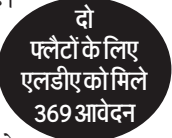
दो फ्लैटों के लिए एलडीए को मिले 369 आवेदन

लखनऊ। राजधानी के पांश इलाके डालीबाग में माफिया मुख्तार अंसारी के कब्जे से मुक्त कराई गई जमीन पर बने लखनऊ विकास प्राधिकरण (एलडीए) के ईडब्ल्यूएस फ्लैटों को लेकर लोगों में एक बार फिर जबरदस्त रुचि देखने को मिली है। दो निरस्त आवंटनों के लिए एलडीए की ओर से खोले गए पुनः पंजीकरण में 369 लोगों ने आवेदन किया है। हैदर केनाल बांध पत्र करीब 20 मीटर चौड़ी सड़क से सटे इस आवासीय परिसर में कुल 72 ईडब्ल्यूएस फ्लैट बनाए गए हैं। बेहतर लोकेशन और किरायेती कीमत के कारण इस योजना को पहले भी लोगों का अच्छा प्रतिसाद मिला था। पिछले वर्ष 72 फ्लैटों के आवंटन के लिए करीब 8,100 आवेदन प्राप्त हुए थे। एलडीए अधिकारियों के मुताबिक, पहले आवंटित किए गए दो फ्लैटों के लाभार्थियों ने निर्धारित समय सीमा में फ्लैट की तय धनराशि जमा नहीं की थी। इसके बाद प्राधिकरण ने दोनों आवंटन निरस्त कर दिए और खाली हुए फ्लैटों के लिए दोबारा पंजीकरण प्रक्रिया शुरू की गई। यह योजना आर्थिक रूप से कमजोर वर्ग (ईडब्ल्यूएस) के लोगों के लिए है। योजना में आवेदन करने के लिए आवेदक की वार्षिक आय तीन लाख रुपये तक होनी चाहिए। इसके अलावा आवेदक या उसके परिवार के किसी सदस्य के नाम लखनऊ में कोई आवासीय भवन नहीं होना चाहिए। पात्रता के लिए आवेदन के साथ शपथ पत्र देना भी अनिवार्य है। एलडीए की इस योजना में प्रत्येक फ्लैट का क्षेत्रफल करीब 35 वर्गमीटर है। फ्लैट की कीमत लगभग 10 लाख रुपये निर्धारित की गई है। इसमें दो कमरे, अलग शौचालय, स्नानघर और बालकनी जैसी सुविधाएं उपलब्ध हैं।